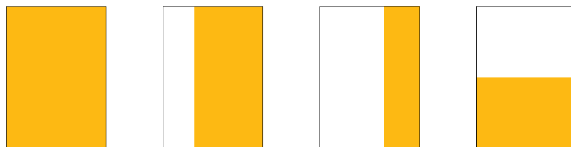
1 página simples: 20,20cm x 26,60cm 2/3 página: 12,70cm x 26,60cm 1/3 página: 6,70cm x 26,60cm 1/2 página: 20,20cm x 13,10cm

Estrutura/formato: 20,2 X 26,6 cm (formatos sangrados: respeitar margem de 1 cm em todos os lados Material: filmless (arquivo fechado PDF com no mínimo 300 DPI, gravado em CD) + prova digital. Toda área de grafismo não sangrada deverá respeitar uma distância mínima de 10mm das laterais e 5mm do pé e cabeça da página. Se essa regra não for obedecida, os textos que estiverem além dessas margens de segurança podem ser cortados no processo de acabamento da publicação. A Editora CARAS não se responsabiliza por anúncios sem prova de cor e entregues fora do prazo. Anúncios recebidos fora do prazo não terão direito a laudo técnico. Coordenação: 2197-2119 /2178 - Para mais informações, consulte: www.abrilgrafica.com.br